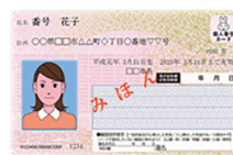
個人番号カード 表面

郵送の場合は、口座名義人様の情報が記載された「 表面 」とマイナンバー(個人番号)が記載された「 裏面 」の両方の コピー をご提出ください。