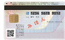
個人番号カード 裏面